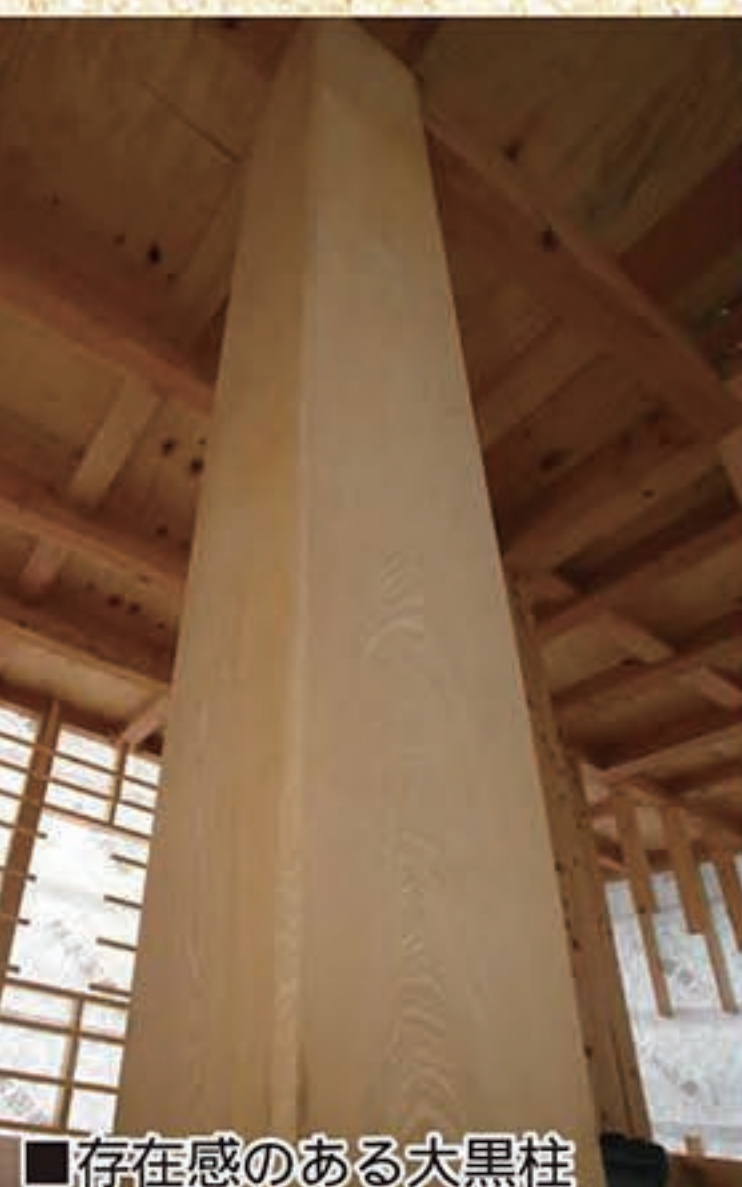
■存在感のある大黒柱