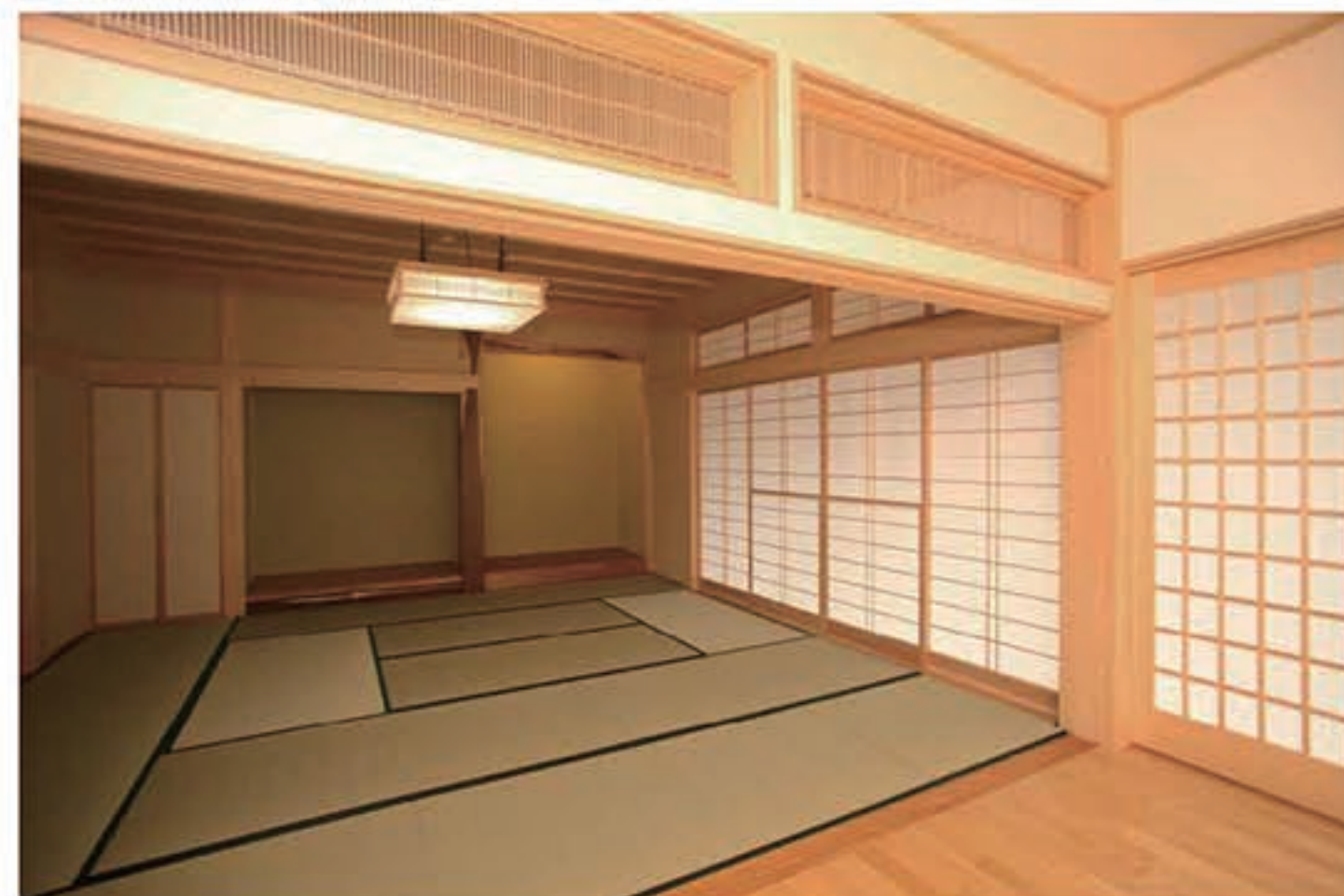
■室内空間における真のゆとりを追求する