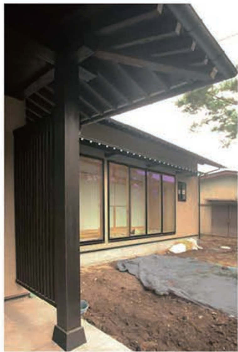
■本物には時を超えても 色褪せない美しさがある