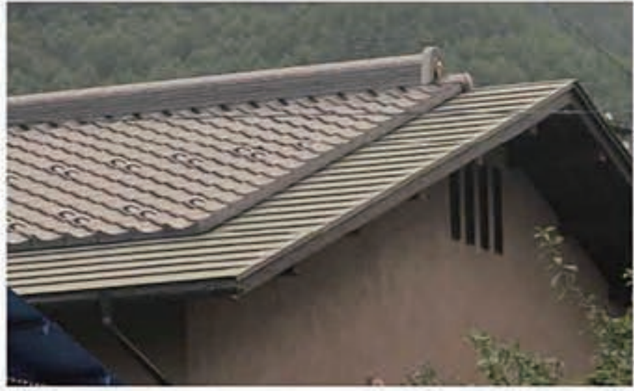
■歴史と技術と誇りを胸に この世に一つしかない邸宅づくりを 極めていく

お客さまのこだわりを、プレミアム品質で応える。 世界にひとつを極める Quality Policy