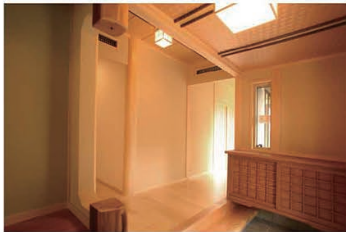
■いくつもの本物が並び立ち 豊かに共鳴する空間