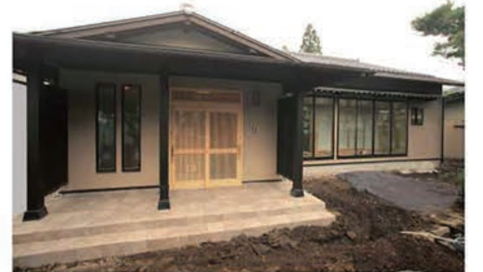
■ひとつの想いをひとつの家に

それを一邸に注ぎこむのが 春原木材のプレミアムクオリティ、 「匠 MEISTER」です。