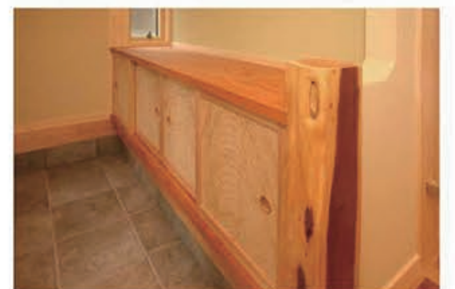
■つくりあげる楽しさ 自分の感性に忠実でありたい