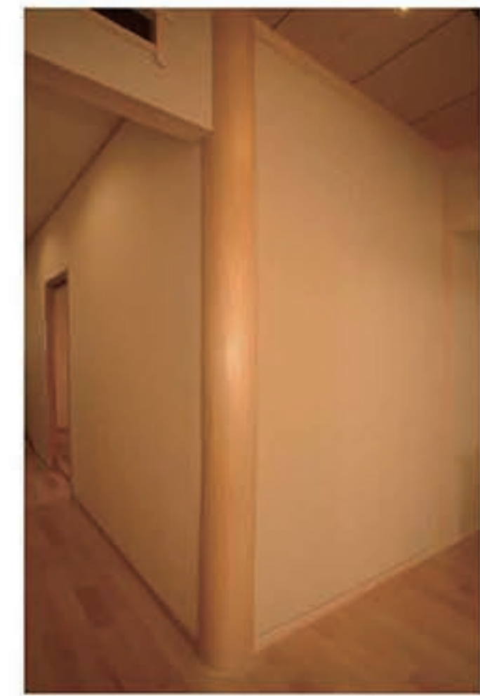
■ひとつひとつこだわって 考えて話し合い そうやってつくる 愛着がわく