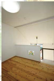
■ロフトを設え、未利用空間をフル活用