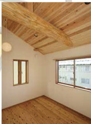
■原風景を覗す丸太梁