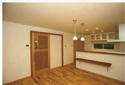
■無垢板のモーニングカウンターで、毎日が特別な時間に