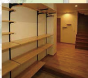
■開放的で機能的なシューズクローク