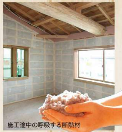
施工途中の呼吸する断熱材

「セルローズファイバー」の家に住むお客様は、昔の古民家のような自然な涼を感じながら、冬のやわらかな暖かさを体感されています。