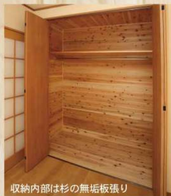
収納内部は杉の無垢板張り

このクオリティポリシーが、お客様に「いつまでも安心して、安全に住み続けることができる本物の住まい」として、選ばれ続けている理由です。