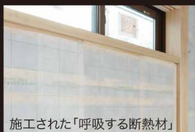
施工された「呼吸する断熱材」

呼吸する断熱材「セルロースファイバー」：見えない部分で壁体内結露は発生してしまいます。セルロースファイバーは湿気を吸ったり吐いたりして、自然に室内の空気をゆっくりとコントロールしてくれます。壁体内部に発生した結露を吐き出すことにより、カビや腐食を未然に防ぎ、家の骨格となる構造体をやさしく守り続けます。