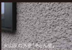
火山灰の外壁「そとん壁」

呼吸する外壁「火山灰そとん壁」：100%自然素材でありながら、独自のメカニズムにより、防水性と透湿性を両立。