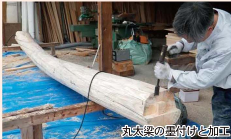
丸太梁の墨付けと加工