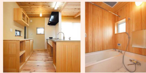
春原木材オリジナル無垢の床材

春原木材オリジナル無垢の床材は、一般的な床材の2倍以上の厚さがあり、素足のままで木のぬくもりを感じられる質感があります。