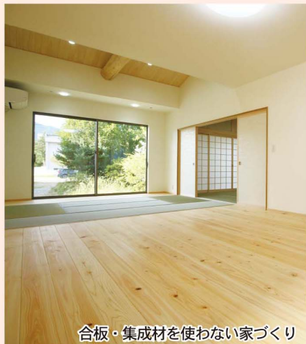
合板・集成材を使わない家づくり

近年の世界情勢や経済状況の不安定な環境で、石油製品や住宅建設に欠かせない新材の高騰は、建築価格に影響しているのが現状です。