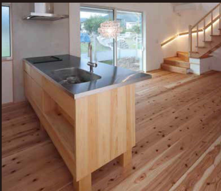
Float Kitchen & Mortex Wall