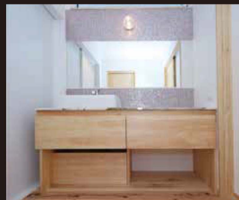
Float Wash Stand