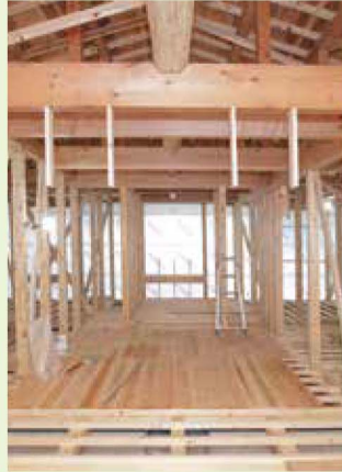
建築価格と建築資材の推移