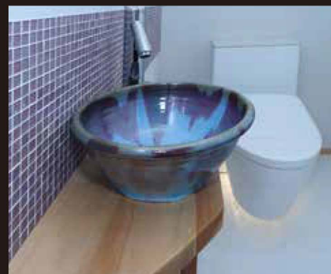
Matsushiro Ware & Float Toilet