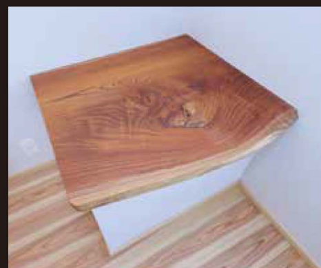
Keyaki Flower Stand